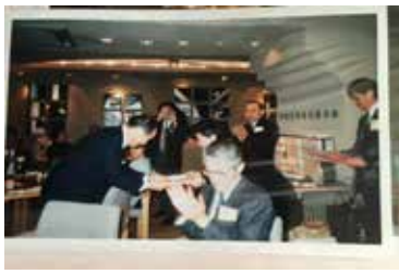
例会にての奨学金贈呈式