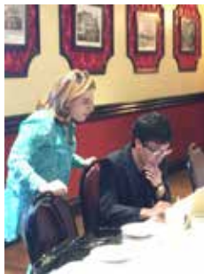
早速交流スタート