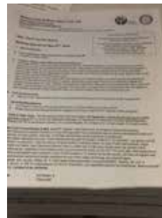
本日の例会の内容