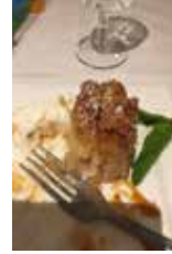
サラダ OR スープ