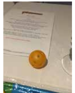
食事有のときの印