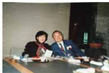
カウンセラーと私