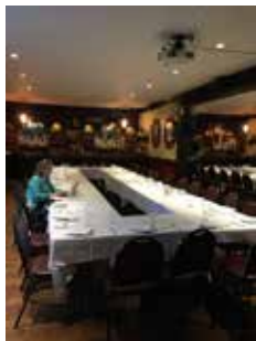
早い時間帯に着いた