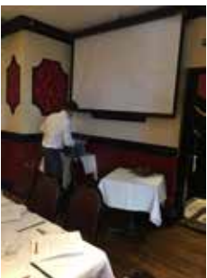
会長一人で例会の準備を