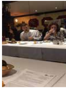
会長兼進行役 クラブの紹介