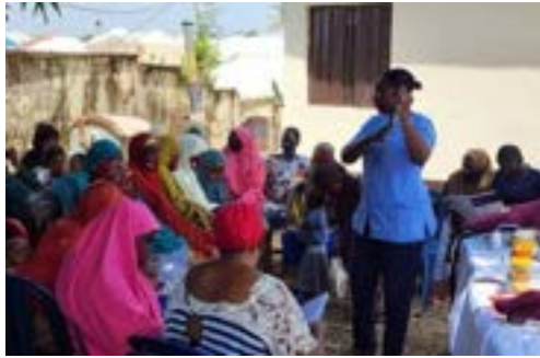
「ナイジェリアの家族の健康のための協力プログラム」で住民とのミーティングを行う医療従事者

にも適用でき、長期的な目標を達成するためのロードマップとして欠かせないものです。