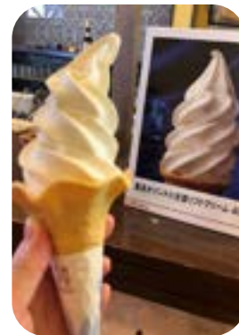
★春光園【ブドウ狩り】