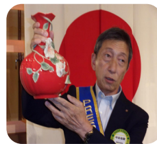
台湾板橋區扶輪社