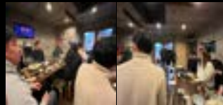
熊本東南RAC、熊本南RAC、熊本グリーンRACの皆さんと合同新年会を行いました！ 来季、熊本南RACさんや大分県、熊本RACさんの留学生交流活動を担当されることもあり、協力・連携しようという話になりました。約り例会もしよう話も。