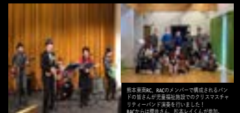
熊本東南RAC、RACのメンバーで構成されるバンドの皆さんが児童福祉施設でのクリスマスチャリティーバンド演奏を行いました！ RACの仲間や皆さん、熊本RACの皆さん、協力・連携しようという話になりました。約り例会もしよう話も。