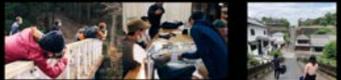
目的：関係人口創出と少子化対策として実施 実施時期：2月くらい？ 対象：九州内のアクト、一般の参加者18歳～40歳くらいまで 募集方法：SNSや九州内の各地区のアクトに案内 実施方法：アクトクラブの所在地を対象に、ホストのクラブが事前に、まちの魅力的なスポットを発掘し、モデルとなる半日アクトコースをいくつか作成する。イベント当日は、参加者にモデルコースから選んだコースを巡ってもらう。