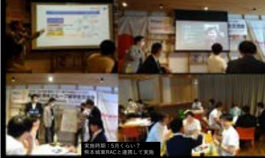
実施時期：5月くらい？ 熊本東南RACと連携して実施