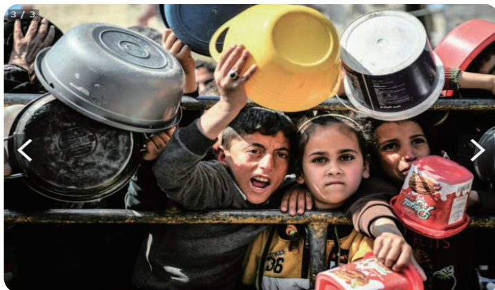
パレスチナ自治区ガザ南部ラファの食料配給センターに食料を受け取りに来た子どもたち 2024年2月25日