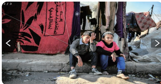
パレスチナ自治区ガザ南部ラファで、テントの前に座るきょうだい 2024年3月7日