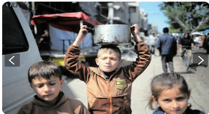
パレスチナ自治区ガザ南部ラファで、食料の入った鍋を頭に載せて通りを歩く子どもたち 2024年3月7日